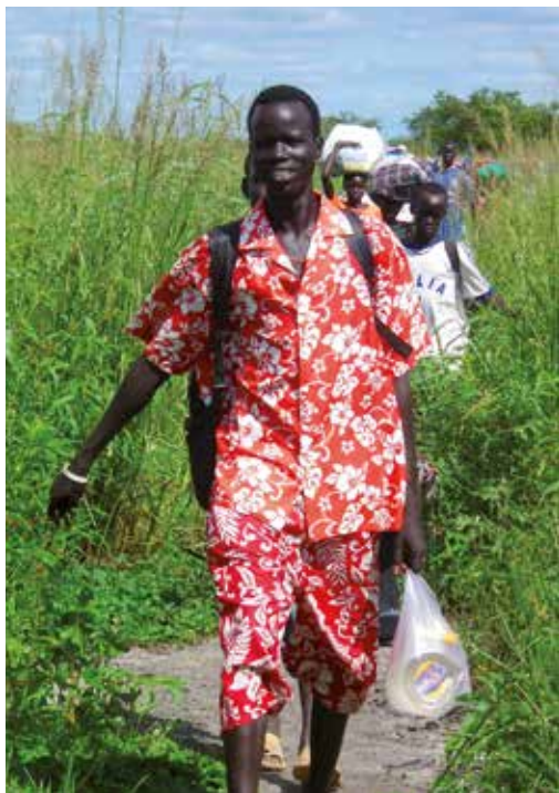
22 „Wir schaffen das“ – als Christen?