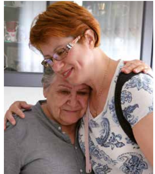
28 Überbringer der Guten Nachricht