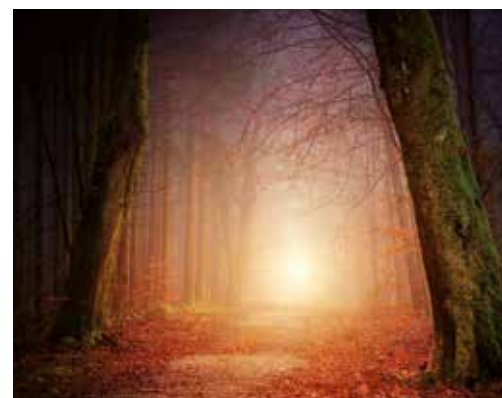
16 Rat von Gott einholen