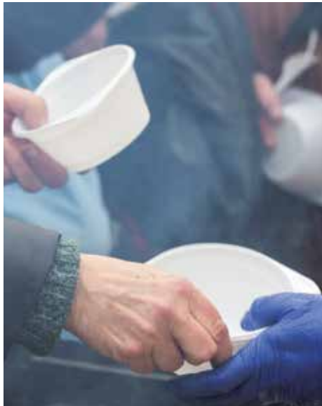
26 ... mit Gerechtigkeit und Güte