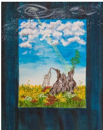
„New Life“ von Ingeborg Mantel

Ergänzende Fotos zu dem Artikel in Charisma 190, S. 31 ff.