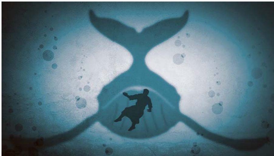
Jona im Wal

HM: Im Buch zeige ich Parallelen zwischen damals und heute auf. In Ninive lebten Menschen, die eine gewisse Art der Frömmigkeit besaßen, nämlich dem heidnischen Polytheismus. Genauso leben heute viele Menschen mit einer Form von Spiritualität und meinen, am Ende werde der liebe Gott sowieso Gnade vor Recht walten lassen. Des Weiteren mussten sich die Menschen in Ninive mit einer heftigen Botschaft auseinandersetzen. Wer die Nachrichten schaut, sieht jeden Tag grauenhafte News und mag beim Anblick des Absturzes von Gesellschaften, Werten und Moral ziemlich düster dreinblicken. Doch genau wie die Leute von Ninive hat der Mensch des 21. Jahrhunderts die Chance, seine Perspektive und sein Leben durch Umkehr und Zuwendung zu Gott zu verändern.